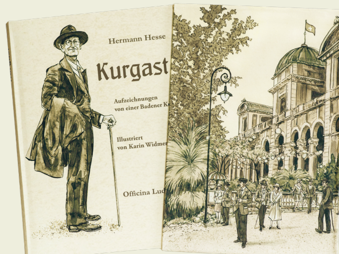
Vorzugsausgabe mit Schuber

info@officinaludi.de · www.officinaludi.de