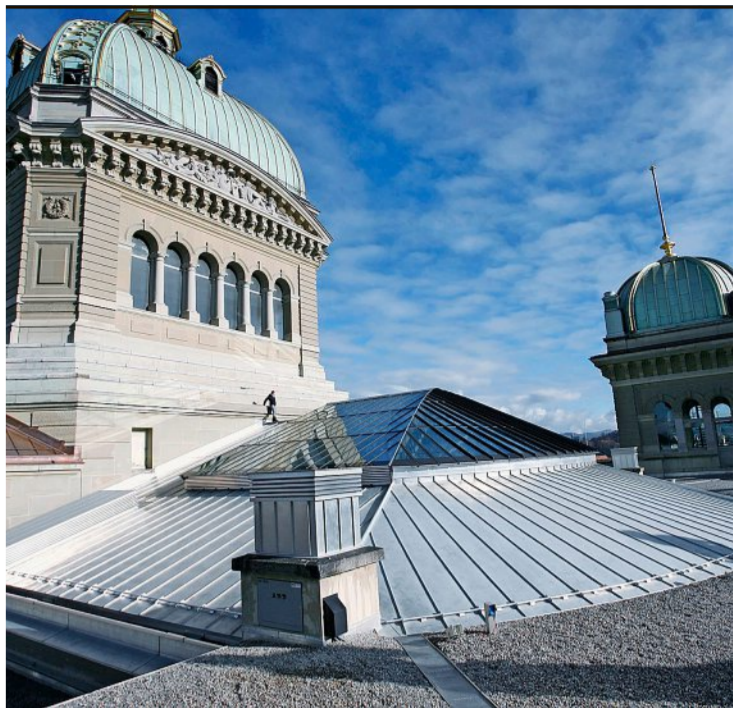
Das Bundeshaus-Dach darf man nicht betreten. Auf dem Archivbild ist ein Fachmann bei Unterhaltsarbeiten zu sehen.