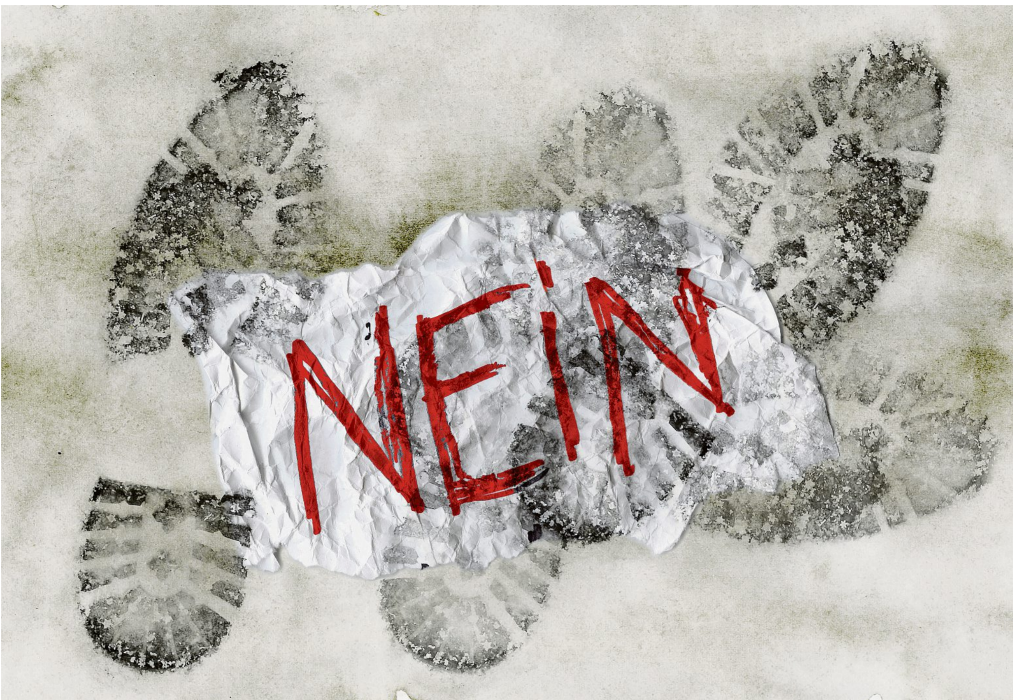
Illustration: Karin Widmer

Es fühlte sich an, als wäre ich an jenem Abend einer Vergewaltigung entgangen. Danach ass ich